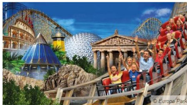
Europa-Park : c'est parti pour la saison 2017 !