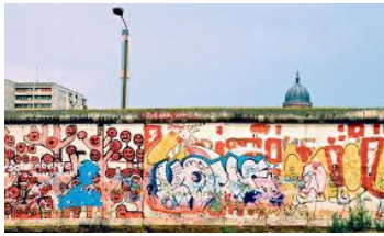
Street Art L'histoire du mur