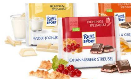
Chocolaterie : Ritter Sport Atelier chocolat