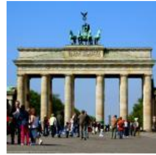
Porte de Brandebourg