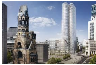
Potsdamer Platz le nouveau Berlin