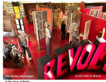
Musée Story of Berlin